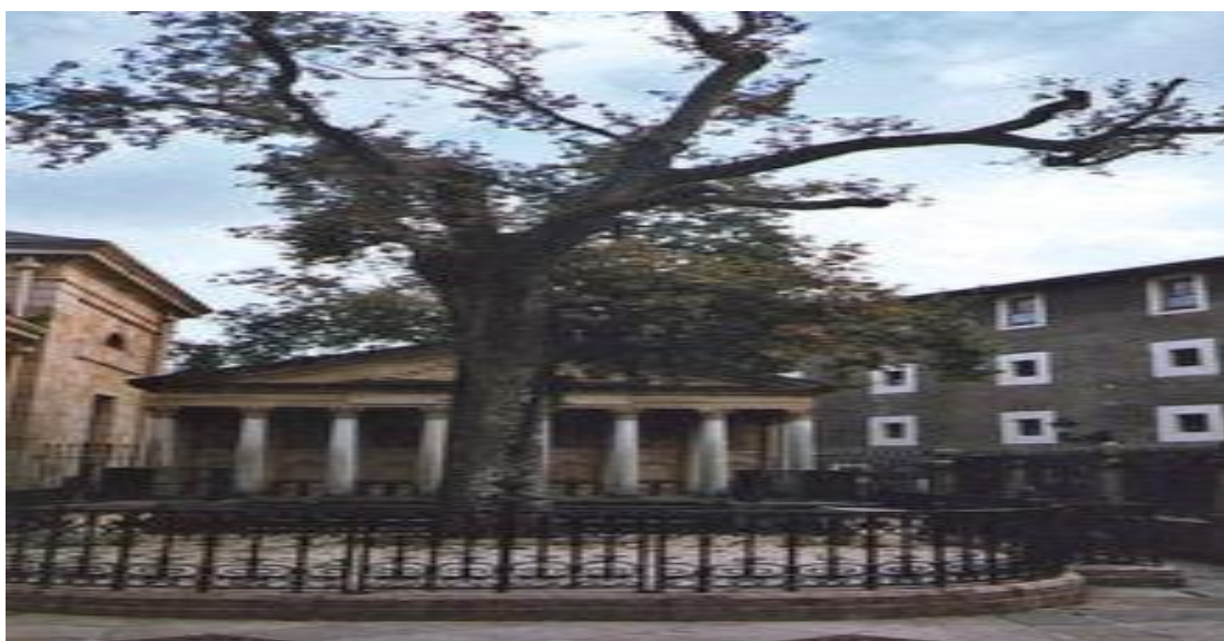
Juntas Generales de Bizkaia La Casa de Juntas de Gernika

Que aprueban los Presupuestos Generales del Territorio; aprueban las Normas Forales, que en el ámbito tributario son competencia exclusiva foral e integran el núcleo foral intangible SENTENCIA 76/1988 ,y que por Ley Orgánica 1/2010. , solo son revisables por el propio Tribunal Constitucional SENTENCIA 118/2016 . Esta Ley Orgánica fue propuesta por la DFB Acuerdo de la DFB de la DFB de 15 de marzo de 2005, . Adjunto el Acuerdo de la DFB Asunto C) FOD con el Anexo 16 que contiene la Propuesta.